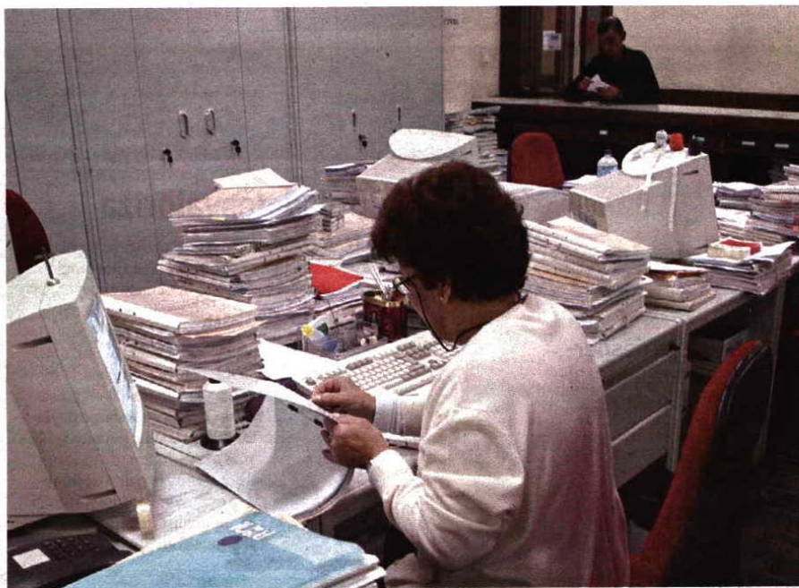
○ Corte no número de funcionários públicos leva o Estado a comprar serviços a empresas terceiras