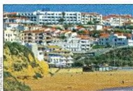
ALGARVE. É A REGIÃO QUE MAIS PERDEU DORMIDAS NO SEMESTRE, QUEBRANDO 73%.