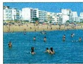
Portugueses evitaram quebra mais forte em junho na hotelaria

O movimento dos hóspedes portugueses permitiu uma queda "menos intensa" do turismo em junho. Nesse mês, os estabelecimentos de alojamento tiveram 493,5 mil hóspedes e 1,1 milhões de dormidas, ou seja, quebras acima dos 80%. Segundo o INE, 46,3% dos hotéis estiveram fechados ou sem hóspedes. ●