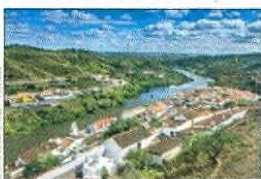
ALENTEJO. É A REGIÃO COM A MENOR QUEBRA NAS DORMIDAS NESTE PRIMEIRO SEMESTRE.