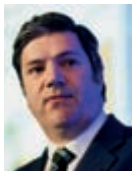
Paulo Núnico , Secretário de Estado dos Assuntos Fiscais, diz que é "dos que consideram que é o sector privado que faz crescer a economia e os empregos."

É por isso que diz não estar convencido de que a viragem na economia portuguesa - que tinha sido sublinhada pelo secretário de Estado dos Assuntos Fiscais, Paulo Núnico, na abertura da conferência - tenha "a pujança suficiente". "E se não virar com a pujança suficiente, o problema manter-se-