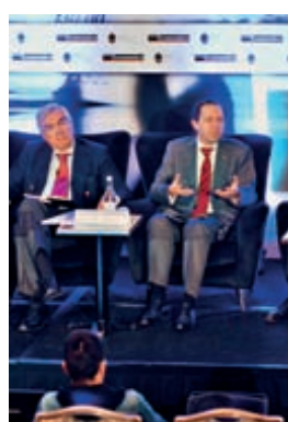
1 O secretário de Estado dos Assuntos Fiscais, Paulo Núnico, presidiu à sessão de abertura. A conferência teve lugar no Salão Nobre do Hotel Ritz, em Lisboa. Contou com a presença de cerca de 200 pessoas.