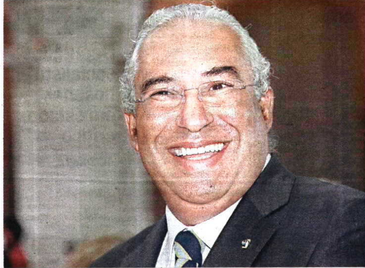
António Costa quer alteração "urgente" do modelo de financiamento dos municípios