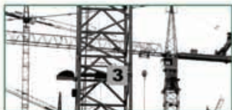
PROJETOS DE DESENVOLVIMENTO