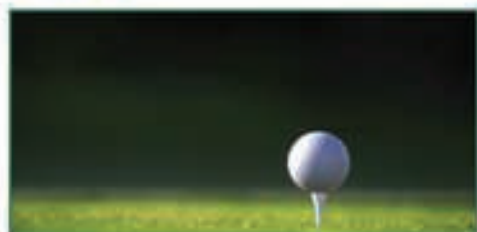
CAMPOS DE GOLFE