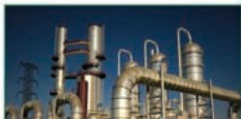
MAQUINARIA E EQUIPAMENTOS