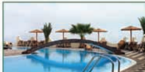
RESORTS E PROJETOS TURÍSTICOS

Desde a avaliação de escritórios até à avaliação de maquinaria de indústria, a nossa dedicação ao rigor e detalhe é aplicada em todas as avaliações. Em 2013 o trabalho de excelência da CBRE foi reconhecido pela Euromoney Real Estate Awards com o prémio de melhor empresa de avaliação em Portugal.